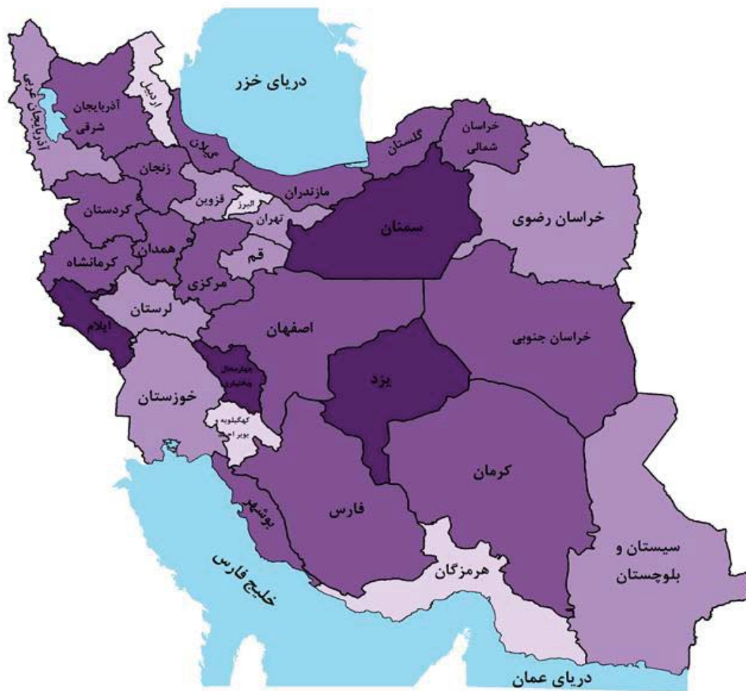
منبع: جدول ۱۸-۲ و ۳-۹