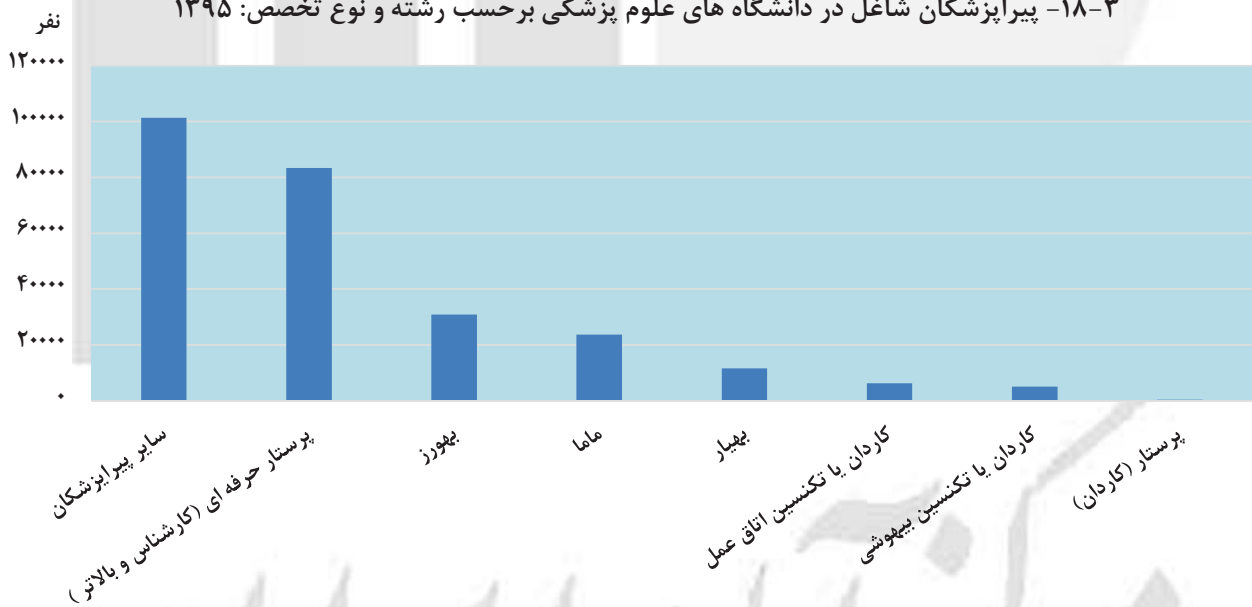
مبنا: جدول ۱۸-۳