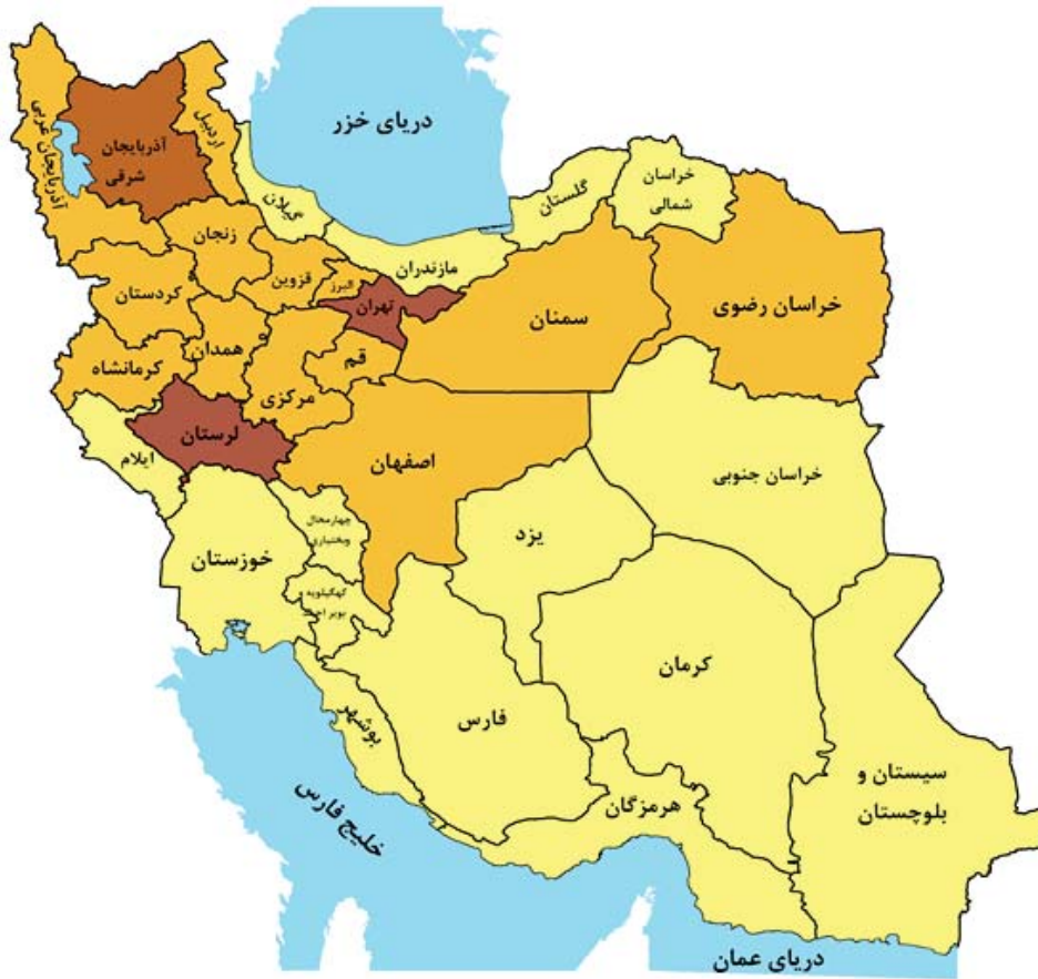
مبنا جدول ۱۰-۶